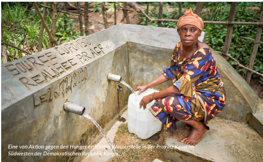
Eine von Aktion gegen den Hunger errichtete Wasserstelle in der Provinz Kasai im Südwesten der Demokratischen Republik Kongo.

Ein weiterer Faktor für die Ausbreitung von Cholera ist der Klimawandel. Überschwemmungen, wie in Bangladesch und dem Südsudan, oder Dürren, wie in Somalia und anderen Teilen Ostafrikas, erschweren den Zugang zu sicherem Wasser und sorgen so für eine schnellere Verbreitung der Krankheit. Unsere Teams sind zur Stelle und sorgen für sichere Trinkwasserstellen und Toiletten, verteilen Wasser, Medikamente und Hygienekits und klären über die Krankheit auf.