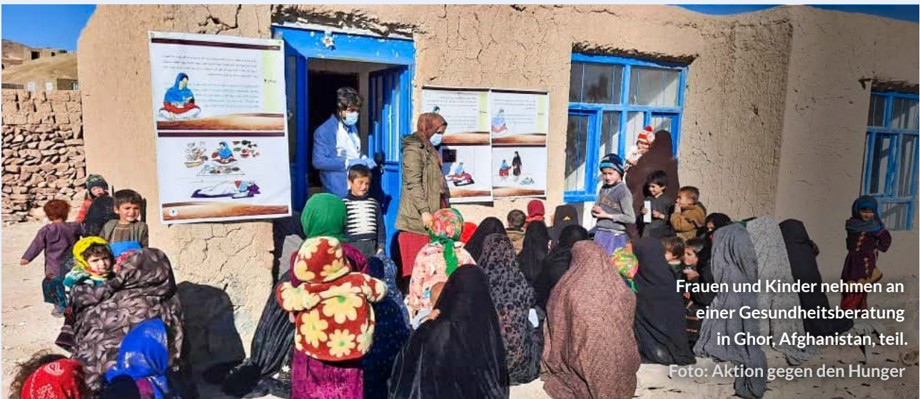
Frauen und Kinder nehmen an einer Gesundheitsberatung in Ghor, Afghanistan, teil.